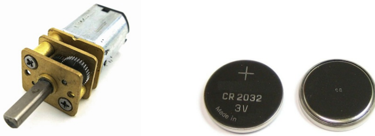
图 2 电动机和电池

2. 装置动力系统的电动机和电池采用指定型号 ( 电动机 N20 减速电动机 , 3V , 100 转/分钟 , 数量 1 个 ; 电池 : CR2032 , 数量不超过 2 个 , 不指定厂家 , 见图 2 )。电子元件 ( 只能是开关、电池底座 ) 及涉及运动的机械零件 ( 如不可拆解的齿轮、齿条、轴等 ) 可以自行采购。除电动机电池外不得安装其他使用电能的装置 , 小车的所有动力均通过电动机输出。